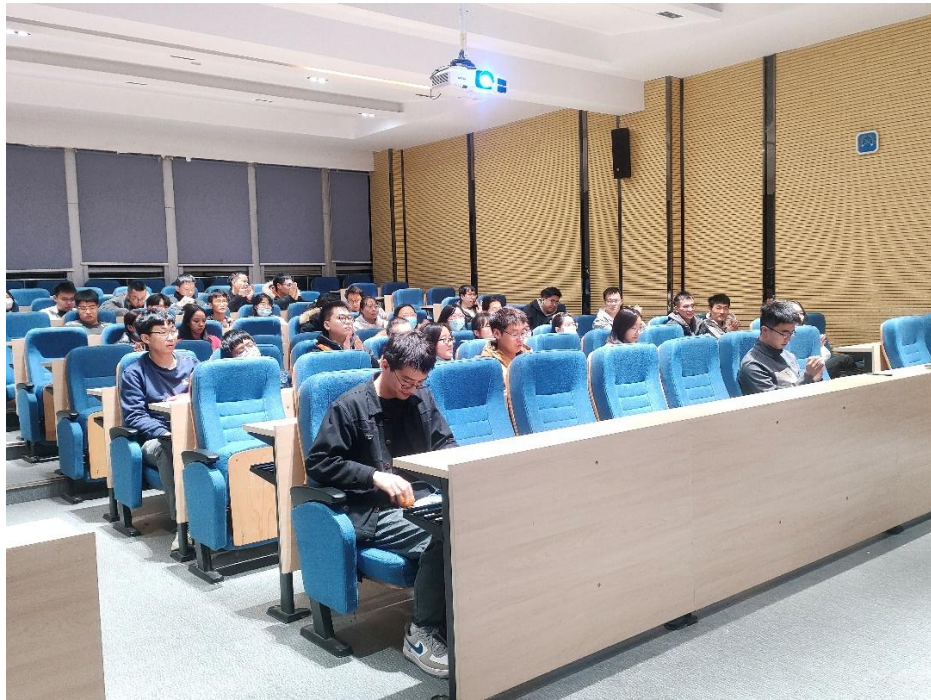
国奖面对面主题活动现场图